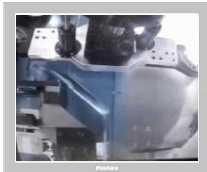
Videografico a sfioramento

Schermo da 7,5" LCD con telecamera ausiliaria all'interno del magazzino utensili